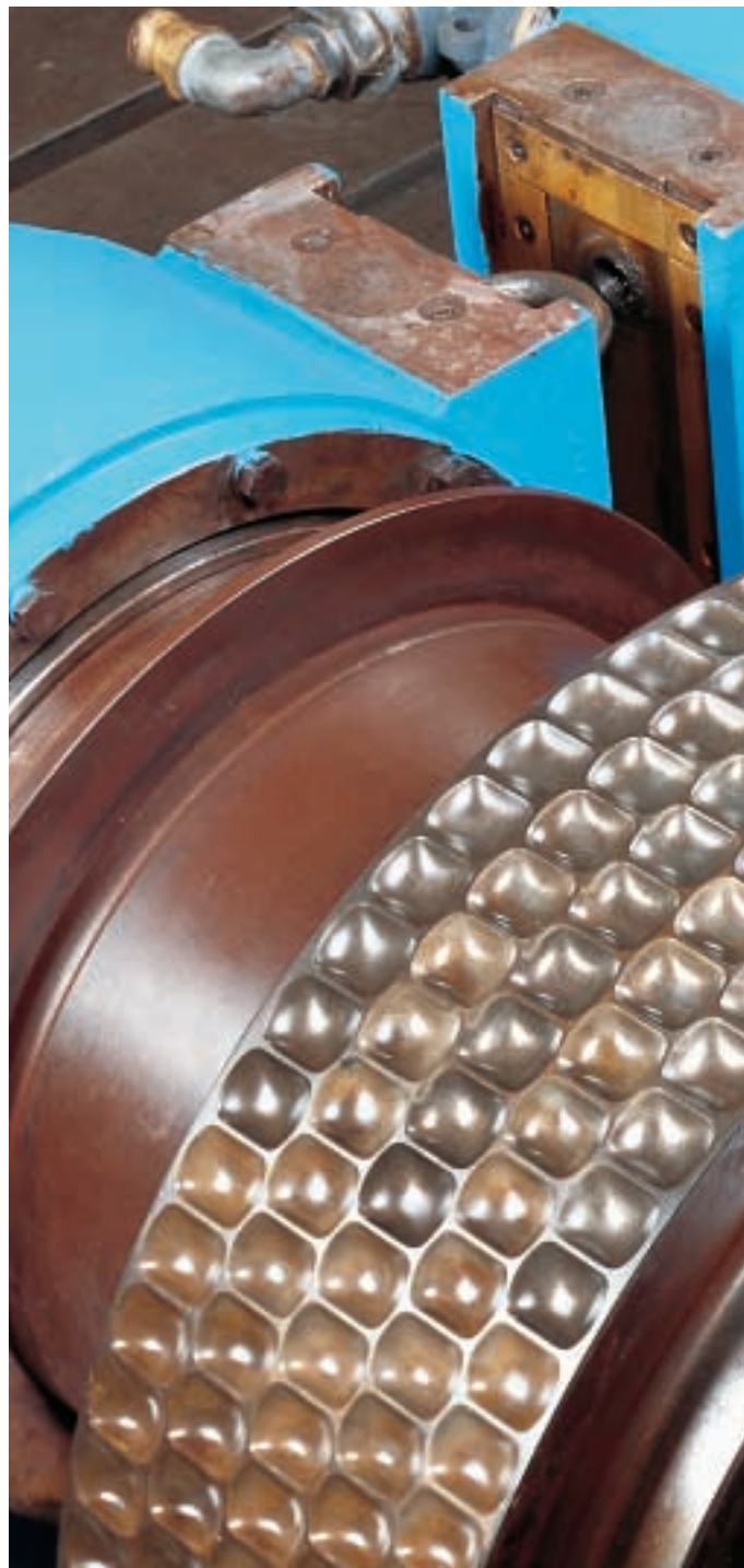
Technische Änderungen vorbehalten. Subject to alterations serving technical advance.

Königsteiner Straße 2-12 D-45529 Hattingen/Ruhr P.O.Box 80 06 53 D-45506 Hattingen/Ruhr fon: ++49/2324/207-0 fax: ++49/2324/207-207 e-mail: info@koeppern.com www.koeppern.com Germany