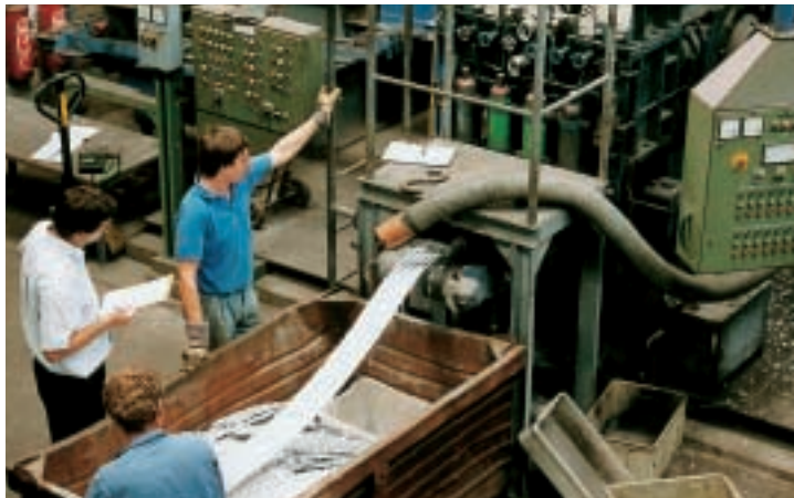
Compaction of aluminium chips and turnings, test in Köppern's pilot plant

Zum Einsatz in einem Schmelzofen müssen Aluminiumspäne einer Schüttdichte von 0,25 t/m 3 kompaktiert werden, um ein Raumgewicht von 2,30 bis 2,55 g/cm 3 zu erhalten. Beim Kompaktieren werden die Späne einer Walzenpresse dosiert zugeführt, zwischen den Walzen zu einem Strang hoher Dichte gepresst und anschließend in einer Strangschere in chargiergerechte Stücke zerteilt.